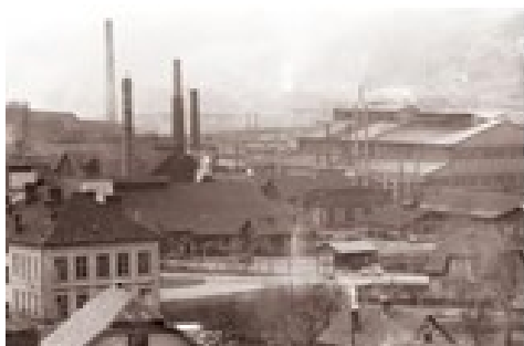
Ravne na Koroškem, 1962

15 let Slovenske poti kulture železa 2003–2018