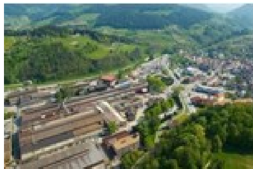
Ravne na Koroškem, 2010